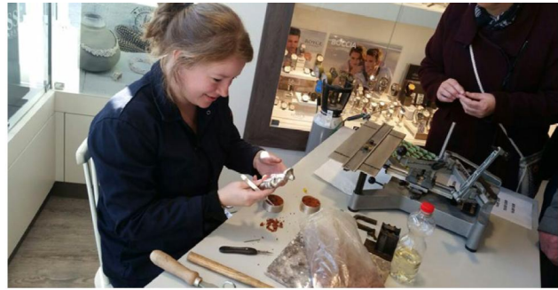
Demonstratie door Juwelier Wissink

De open dag zorgt voor extra traffic in winkel of atelier, en dat komt in november - met de feestdagen voor de deur - natuurlijk goed uit; sieraden en horloges moeten hoog op de verlanglijstjes van consumenten. De dag is hét moment om te laten zien wat je voor de mensen kunt betekenen, aldus de FGZ.