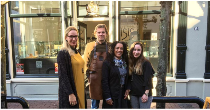
Een deel van het team van Isis