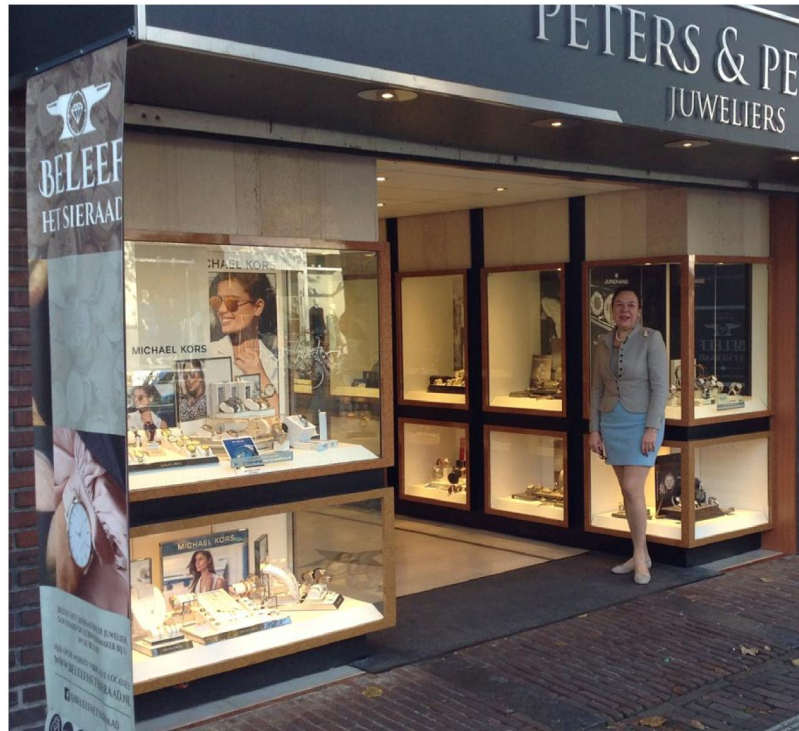
Juwelier Peters & Peters is er klaar voor