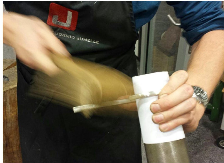
De goudsmid van Jumelle maakt een slavenarmband